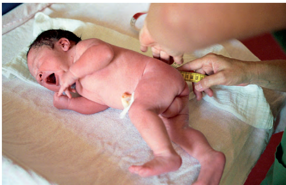
Länge/Gewicht: Das Neugeborene wird gewogen und vermessen (Länge und Kopfumfang).

derstands im Ösophagus, der sich bei verschiedenen Zuständen in typischer Weise ändert).